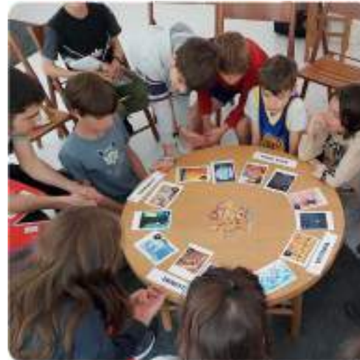
CLUB DE LECTURA Marc Alabart – Tàndem LIJ.

4 sessions. Migdia. Grup reduït. Alumnat: 4t de Primària.