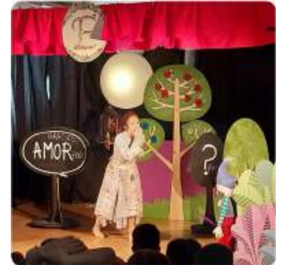
TEATRE-TITELLES-DANSA-MÀGIA Womagis, el mag de les paraules. Kali Teatre.

4 sessions. Migdia. Grup reduït. Alumnat: 4t de Primària.