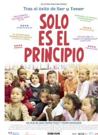
Pozzi, J.P. y Barouquier, P. (2010) Solo es el principio França. 98 min.

L'autora d'aquest documental va gravar durant mesos els infants al pati d'un parvulari francès, sense intervenir, amb la intenció d'exposar les interaccions entre iguals i com en aquestes surten a la llum sentiments i comportaments de tota mena.