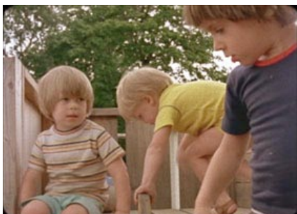
Guzzetti, A. (1980) Scenes from Childhood EUA. 78 min.

Malgrat que en moltes pel·lícules surten infants com a protagonistes, són molt poques les que reflecteixen la vida entre infants des del seu punt de vista.