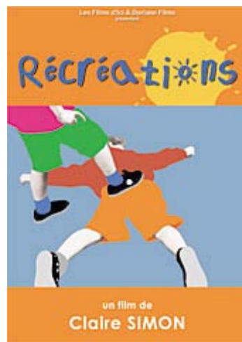
Simon, C. (1992) Récréations França. 95 min.

És un documental on es mostren reallats d'escenes quotidianes en què els protagonistes són un grup de nens i nenes de 3 a 5 anys. En aquestes filmacions es pot veure com es relacionen entre ells i com afronten diferents situacions sense la presència d'adults.