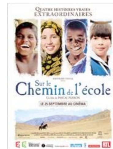
Plisson, P. (2013) Sur le chemin de l'école França. 77 min.

Documental sobre les classes de filosofia per a nens de parvulari, que promouen la reflexió sobre la nostra capacitat ètica, social i humana i sobre la importància d'una bona educació des de la infància. Els infants que tenen entre tres i quatre anys exposen lliurement, amb les seves emocions i contradiccions, durant l'hora de filosofia, les seves idees sobre l'amor, la llibertat, la intel·ligència, la mort, etc.